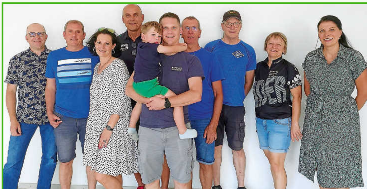
Siegerehrung der Stadtradeln-Teilnehmer im Gemeindesaal am 25. Juni 2024

Die beiden Teams mit den meisten Gesamt-Kilometern („Killertal-Express“) und den meisten Kilometern pro Kopf („Die Bullis“) erhielten jeweils einen Gastronomieutschein im Wert von 160 €. Unter den übrigen Teams wurden acht weitere Gutscheine im Wert von 160 € verlost. Viele Teams waren bei der Siegerehrung vertreten und holten sich ihre Urkunden ab. Die Gemeinde lud im Anschluss zum gemeinsamen Plausch bei kühlen Getränken ein. Das Stadtradeln fand in diesem Jahr bereits zum vierten Mal statt!