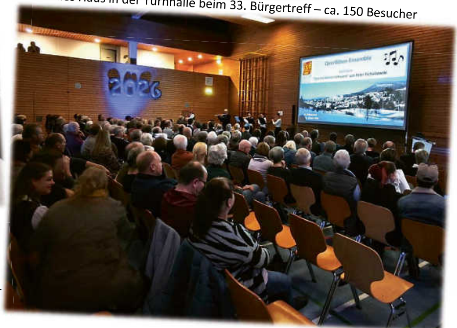
Volles Haus in der Turnhalle beim 33. Bürgertreff – ca. 150 Besucher