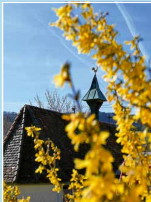
Oliver Simmendinger Bürgermeister

Herzliche Ostergrüße aus dem Rathaus, Ihr