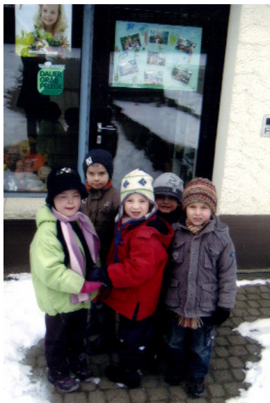
„Wir sind schon ganz gespannt!“