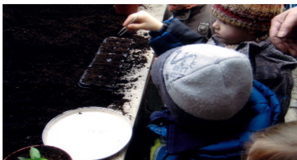
Tomaten säen mir der Pinzette