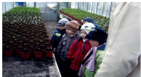
So viele Blumen sind schon gepflanzt.