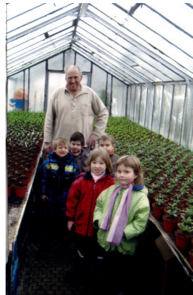
„Das Gärtnern hat uns viel Spaß gemacht!“